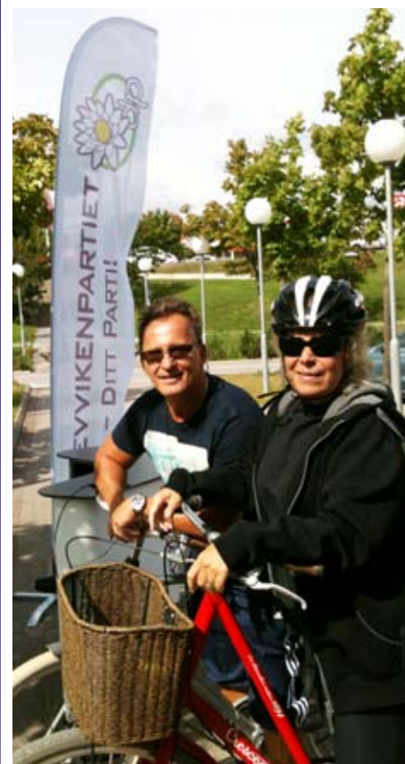
Två av deltagarna i Drevvikstrampet vid starten vid Läna Sport.

Drevvikstrampet var uppskattat av deltagarna som i och för sig kunde varit fler. Nästa år lägger vi nog en lite kortare bana. Vi tackar Läna Sport för gott samarbete och fina priser.