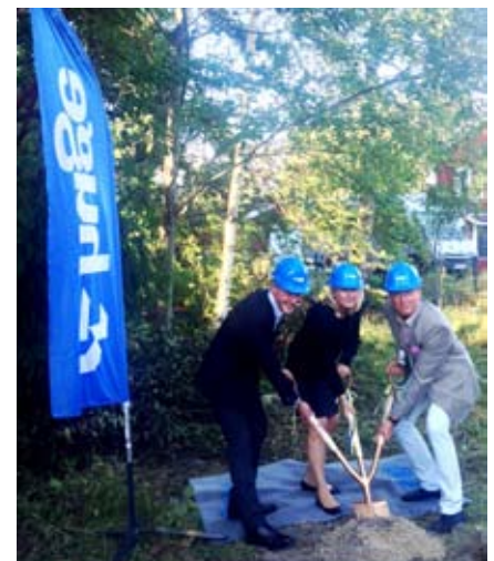
Första spadtaget vid Nytorps mosse.

Nu pågår också bygget av den nya förskolan vid Nytorps mosse för fullt. Den får fem avdelningar och ska bland annat ersätta förskolan Tuvan på Tjäderstigen som bara har haft ett tillfälligt bygglov vilket nu går ut.