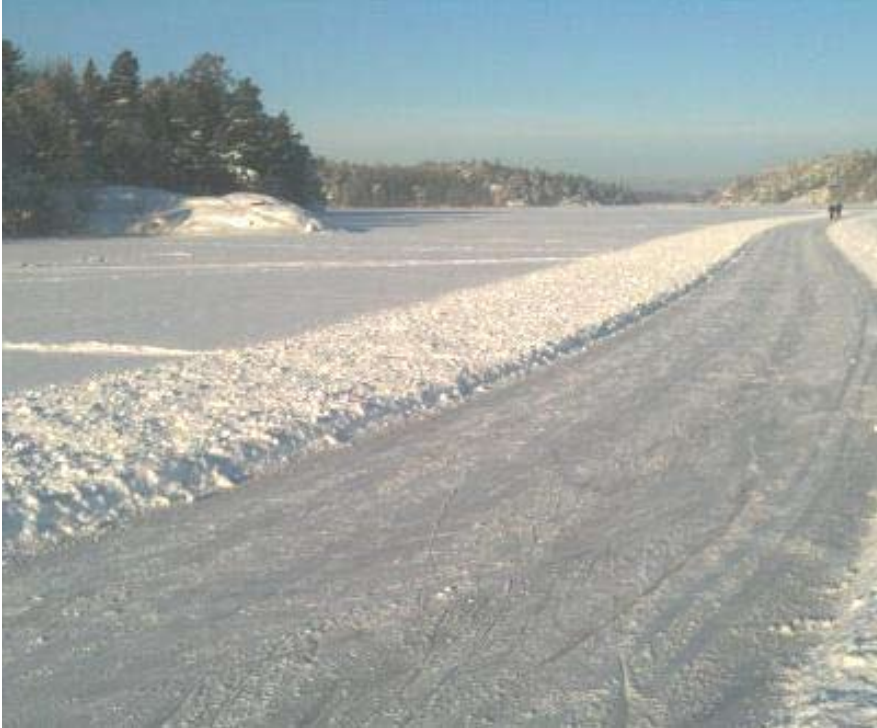
Den plogade bana på Drevviken, här vid Sjöängsbadet där starten för Drevviksrännet går den 15 februari.

Drevviksrännet 2015 blir nu verklighet om inte vädret sätter käppar i hjulet. Drevviksrännet är namnet på den plogade skridskoslingan runt sjön Drevviken. Det är också namnet på det långfärdsskridskolopp som går av stapeln den 15 februari. Loppet är inte bara ett skridskolopp. Det ska i första hand vara en familjedag där alla kan delta, även om man inte vill åka hela sträckan på två mil.