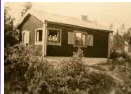
Bild på en av sportstugorna i området.

Området hade många sommarstugor som också kallades sportstugor. Idag finns endast ett fåtal kvar. Sportstugeägarna var driftiga och entusiastiska och bildade 1935 en tomtägareförening med namnet Drevviksstrand-Skogås Tomtägareförening.