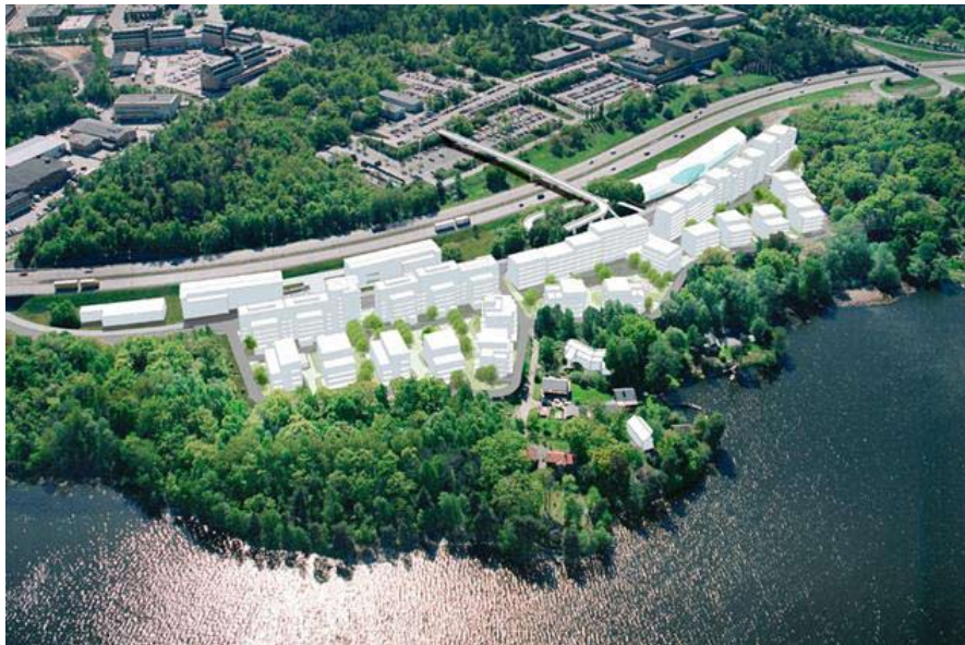
Vid Larsboda strand eller Klockelund, där Plantagen ligger idag, planeras 500 nya bostäder.

Norr om vår kommun del pågår planering för fullt med att utveckla Farsta. Vi har varit på samrådsmöte och tagit del av planerna på plats hos samhällsplanerare på Stockholms stad.