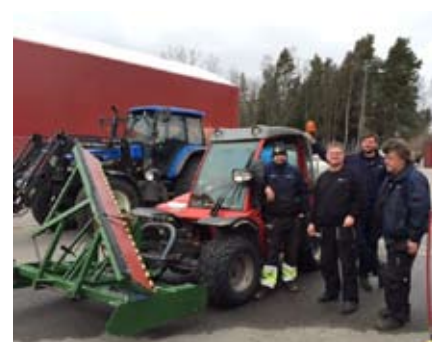
Idrottsförvaltningens manskap som så förtjänstfullt plogat isen i vinter.

Det är Idrottsförvaltningen i Stockholms stad som står för plogningen av själva banan – och ett utmärkt underhåll av den!