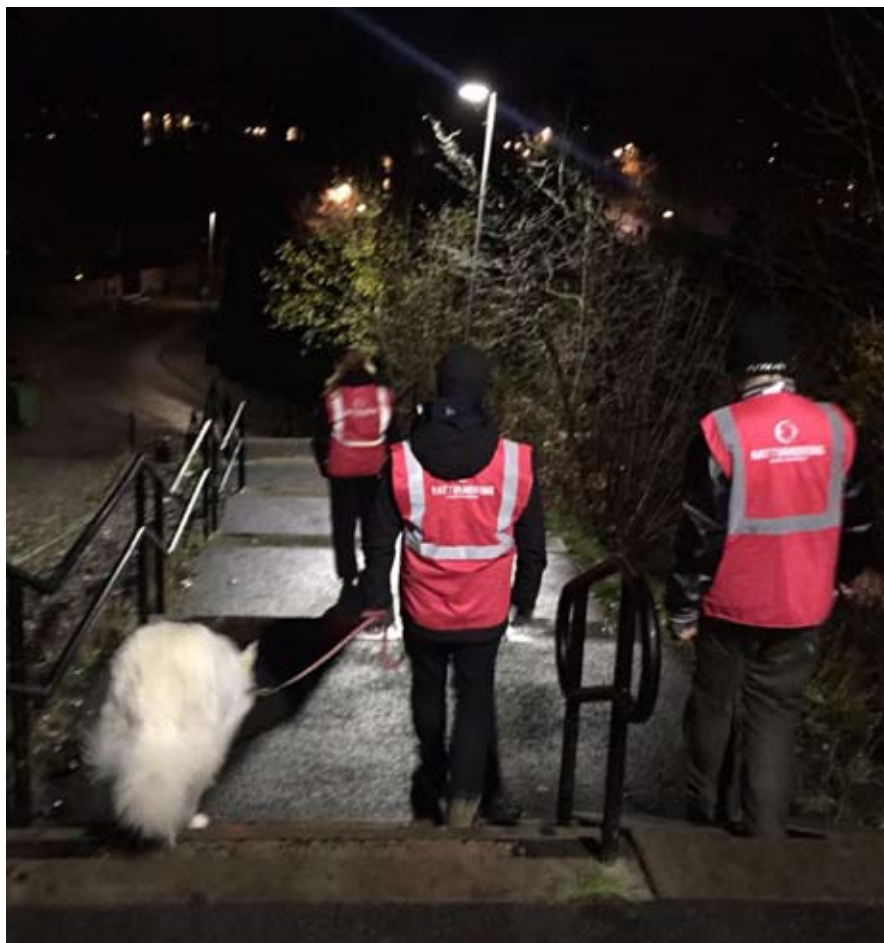
Frivilliga nattvandrare bidrar till ökad trygghet i Trångsund på fredags- och lördagskvällar.

Beredningen ska dessutom följa kommunens arbete med de nya riktlinjerna för kamerabevakning, klotterrelaterad skadegörelse, förebygga och förhindra våldsbejakande extremism samt följa arbetet med trygghet och säkerhet i samhällsplaneringen.