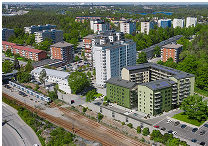
Illustrationen visar de gröna husen som är de nya lägenheter som Huge bostäder AB bygger vid Trångsunds centrum.

Det är mycket som händer nu i Skogås och Trångsund. Bygget av nya flerfamiljshus i Trångsund centrum har kommit igång. Först byggs ett parkeringsgarage och snart börjar Huge bygga de 125 lägenheterna mellan infartsparkeringen och centrum.