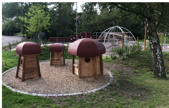
Prinzparken vid Stortorps äldrecentrum, en i raden av nya eller upprustade fina lekplatser i vårt område.

Annat nytt och fint är upprustningen av Prinzparken vid Stortorps äldrecentrum som fått ny lekutrustning med ek(o)-tema. Här finns gulliga lekhus i form av ekollon, gungor och en spännande klätterställning.